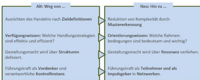
(Auszug aus: Agile Führungskultur)

und wissenschaftlich fundierten vertretbaren Vorgehensweise mit Fokus auf eine vertrauensvolle Kommunikation. Mit seinem interdisziplinären, methodischen, technischen, wirtschaftlichen und psychologischen Background deckt er alle Voraussetzungen als Ihr persönlicher Erfolgsberater umfassend ab.